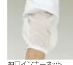
袖口インナーネット