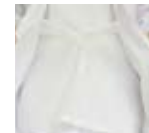
ウエストインナーネット マジックテープあわせ