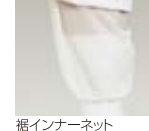
裾インナーネット