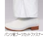
パンツ裾ブーツカットファスナー