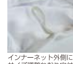
インナーネット外側に サイズ調整ねむり穴付 ※袖口、裾インナーネット のゴムは、靴、足筒の太さ に合わせて「ねむり穴」から 調節できます。 P82調整方法